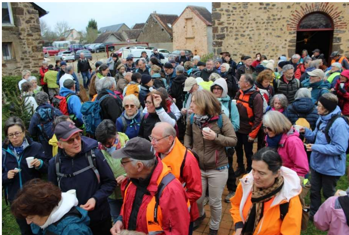
13 ème Randonnée Patrimoine sur le grand chemin du Mont St Michel depuis Le Mans Au départ - Entre La Chapelle St Fray et Le Mans - 23 Mars 2025